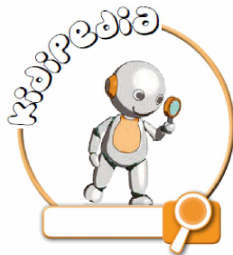
Abbildung 2: Logo von kidipedia.

Im Bereich der digitalen Lernangebote nimmt kidipedia eine besondere Rolle ein und hebt sich aufgrund der beschriebenen „didaktische[n] Implikationen“ (Peschel et al. 2012, 57) von anderen Onlineangeboten ab. Im Gegensatz zu bestehenden Wikis, die hauptsächlich textzentriert sind, fördert kidipedia Lese-, Schreib- und Technikkompetenzen durch die Darstellung von Experimenten in multimedialer Form, also mit Fotos, Videos und Audiomaterial (vgl. Peschel 2010b, 11). Diese Einbindung von Multimedia-Dateien stellt ein ‚Kernstück von kidipedia‘ dar. Dadurch, dass Beiträge von den Kindern selbst verfasst werden, findet eine Reflexion der Ergebnisse der Kinder statt. Zudem erfolgt die Beitragserstellung in einer kindgerechten Sprache. Das führt auf der einen Seite dazu, dass zwar ggf. inhaltliche Fehler präsentiert werden, auf der anderen Seite ist das Wissen aber adressatengerecht aufbereitet. Die Kinder können und sollen das Wissen von anderen rezipieren und haben durch die ‚Wiki-Funktionalität‘ die Möglichkeit, Beiträge eigenständig zu editieren. Die Konfrontation mit ggf. unfertigen bzw. nicht ganz korrekten Sachverhalten gibt wiederum Anlass, Quellen (die nicht nur beim geographischen oder historischen Lernen wichtig sind) zu hinterfragen und zeigt gleichsam die Entwicklung von gemeinsamem und gesichertem Wissen.