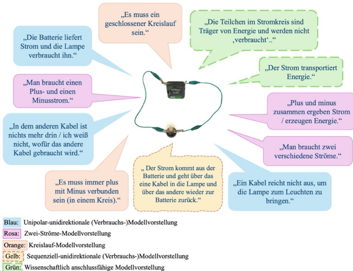
Abbildung 1: Aus der Literatur abgeleitete beispielhafte Kinderaussagen, welche auf verschiedene zugrundeliegende (Modell-)Vorstellungen zum elektrischen Strom schließen lassen.

5) Wissenschaftlich anschlussfähige Modellvorstellung: Zwischen den zuvor beschriebenen Modellvorstellungen und einer, die mit wissenschaftlichen Grundlagen konform ist, gibt es weitere Zwischenstufen, die hier der Übersichtlichkeit halber nicht weiter aufgeführt werden. Die o.g. Aufzählung ist also keineswegs vollständig, sondern veranschaulicht mehr die verschiedenen Entwicklungsstufen der Modellvorstellungen. Eine wissenschaftlich bzw. fachlich anschlussfähige Modellvorstellung zum elektrischen Strom – insbesondere mit Hinblick auf den Energietransport durch elektrischen Strom – beschreibt elektrische Ladung als Träger elektrischer Energie. Diese Energie wird in von Elektrizität „betrieben“ Geräten gewandelt/genutzt. Bezüglich des Energiekonzepts, speziell zum Energietransport durch elektrischen Strom, könnte auch die Untersuchung der folgenden Frage sehr interessant sein: „Wenn keine Ladung(-sträger) ‚entnommen/übertragen‘ wird(werden), woraus manifestiert sich die Energie, die ‚entnommen/übertragen‘ wird? Aus dem nichts/aus dem Spannungsabfall/...?“ (Spannungsabfall als Analogie zur Abnahme der potenziellen Energie im Kontext der Mechanik).