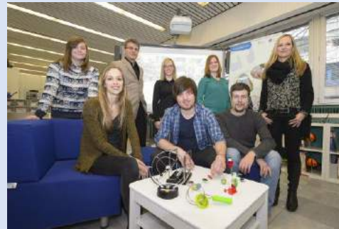
Arbeitsgruppe am Lehrstuhl für Didaktik des Sachunterrichts